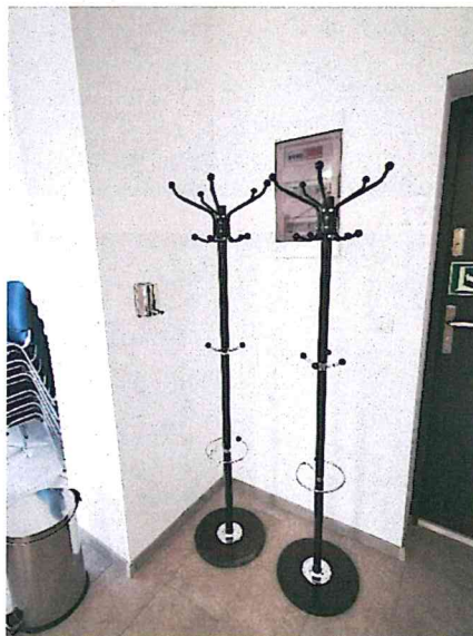
Zdjęcia części wyposażenia

W celu otrzymania trwałości projektu w wymiarze ½ etatu od 1 sierpnia 2022 r. w świetlicy wiejskiej w Radzimi zatrudniony jest pracownik – animator.